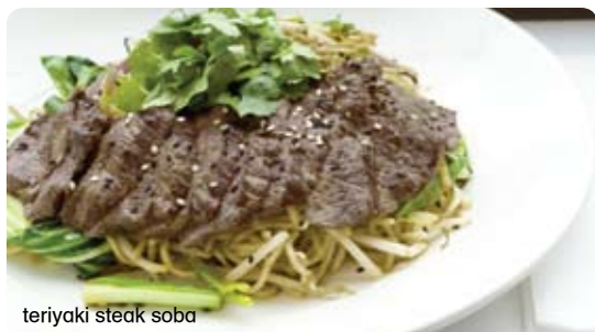
teriyaki steak soba

46 teriyaki salmon soba €12.50 μαριναρισμένος σολομός και soba νουντλς ψημένα στο teppan με curry oil, mangetout, chillies, σκόρδο, κρεμμύδι, ρίζες φασολιών σόγιας και σπανάκι σερβίρεται με σάλτσα teriyaki και γαρνίρεται με κόλιανδρο και σουσάμι