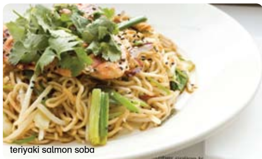
teriyaki salmon soba

47 teriyaki chicken €10.60 μαριναρισμένο κοτόπουλο και κόκκινα κρεμμύδια με σάλτσα teriyaki σερβίρεται με ρύζι ιαπωνικού τύπου. γαρνίρεται με ανάμεικτα λαχανικά και σουσάμι και κόκκινες πίκλες