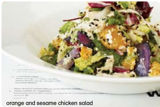
orange and sesame chicken salad