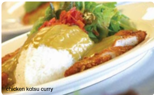
chicken katsu curry