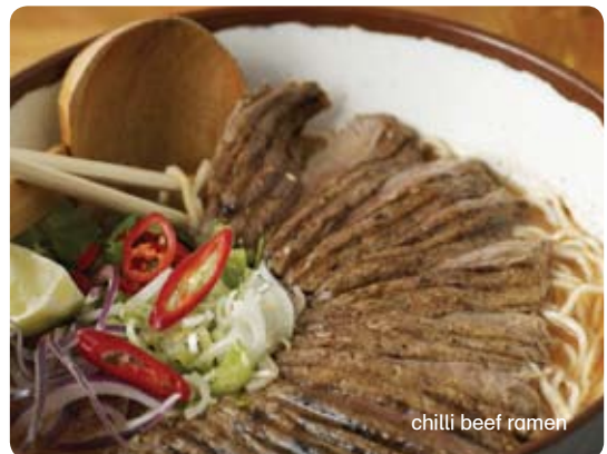
chilli beef ramen

όλα τα ramen μπορούν να σερβιριστούν και με ζωμό λαχανικών. παρακαλώ όπως ζητηθεί από το σερβιτόρο σας