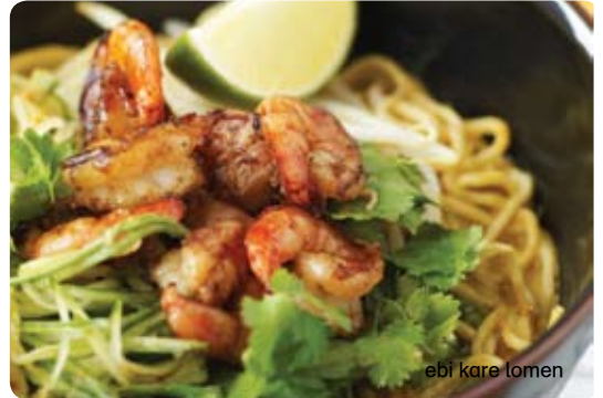
ebi kare lomen

ramen νουντλς σε πικάντικη σάλτσα lemongrass, γάλα καρύδας, φρέσκο ginger και κόκκινες πιπεριές. σερβίρεται με μαριναρισμένες ψητές γαρίδες, ρίζες φασολιών σόγιας, αγγούρι, φρέσκο κόλιανδρο και μια φέτα λάιμ