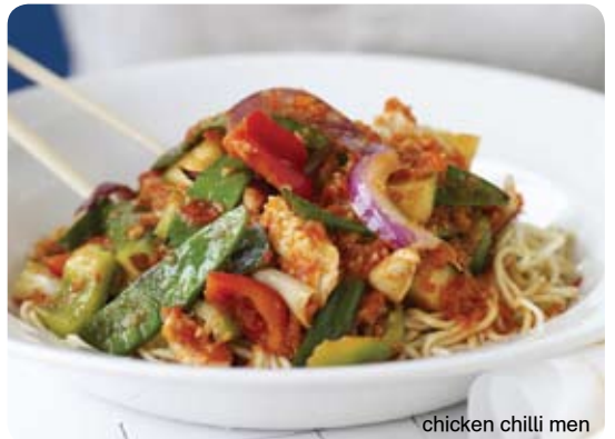
chicken chilli men