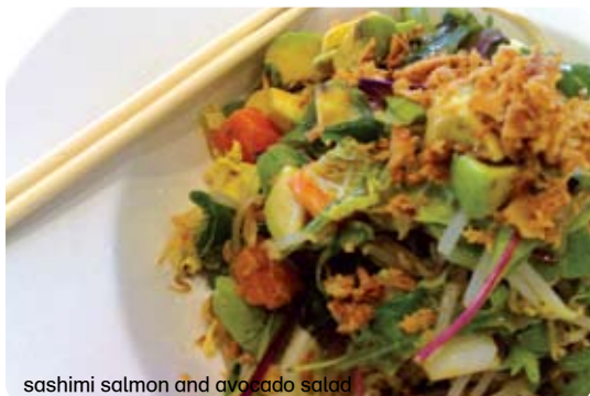
sashimi salmon and avocado salad