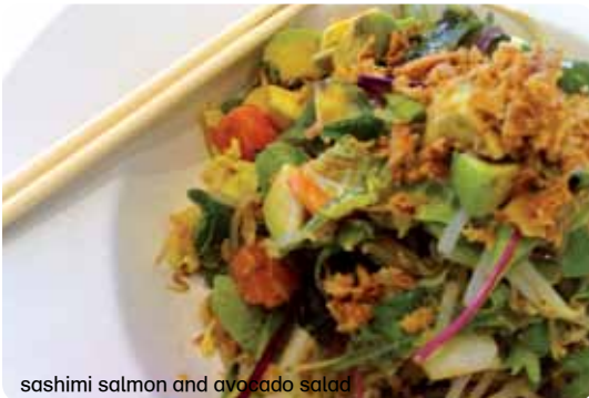
sashimi salmon and avocado salad