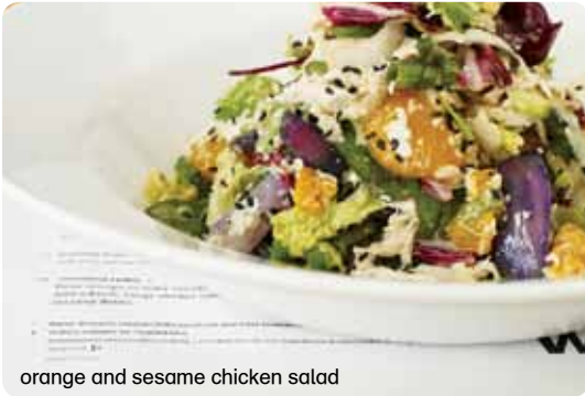
orange and sesame chicken salad