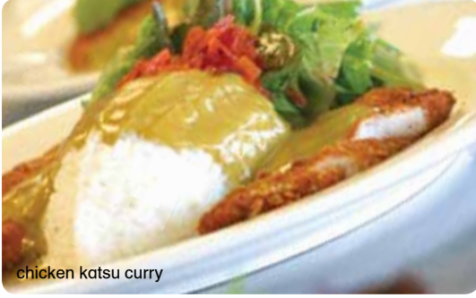
chicken katsu curry