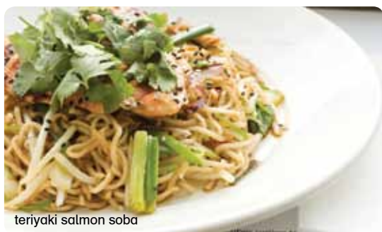
teriyaki salmon soba

47 teriyaki chicken €11.30 μαριναρισμένο κοτόπουλο και κόκκινα κρεμμύδια με σάλτσα teriyaki σερβίρεται με ρύζι ιαπωνικού τύπου. γαρνίρεται με ανάμεικτα λαχανικά και σουσάμι και κόκκινες πίκλες