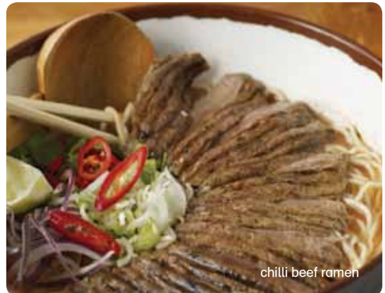
chilli beef ramen