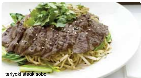
teriyaki steak soba

46 teriyaki salmon soba €13.20 μαριναρισμένος σολομός και soba νούντλς ψημένα στο teppan με curry oil, mangetout, chillies, σκόρδο, κρεμμύδι, ρίζες φασολιών σόγιας και σπανάκι σερβίρεται με σάλτσα teriyaki και γαρνίρεται με κόλιανδρο και σουσάμι