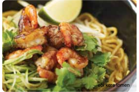
ebi kare lomen

ramen νουντλς σε πικάντικη σάλτσα lemongrass, γάλα καρύδας, φρέσκο ginger και κόκκινες πιπεριές. σερβίρεται με μαριναρισμένες ψητές γαρίδες, ρίζες φασολιών σόγιας, αγγούρι, φρέσκο κολιάνδρο και μια φέτα λάιμ